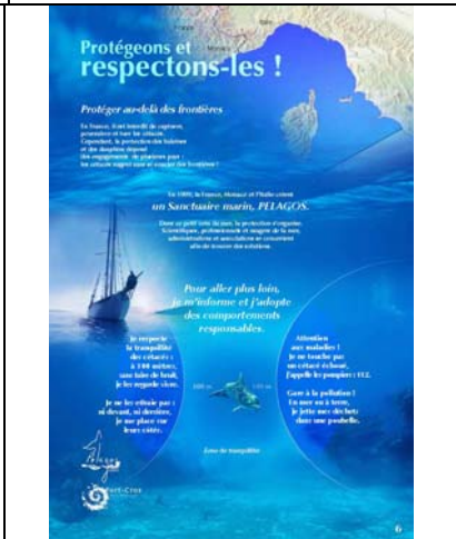
Protégeons et respectons-les