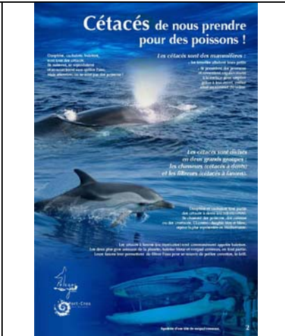
Cétacés de nous prendre pour des poissons !