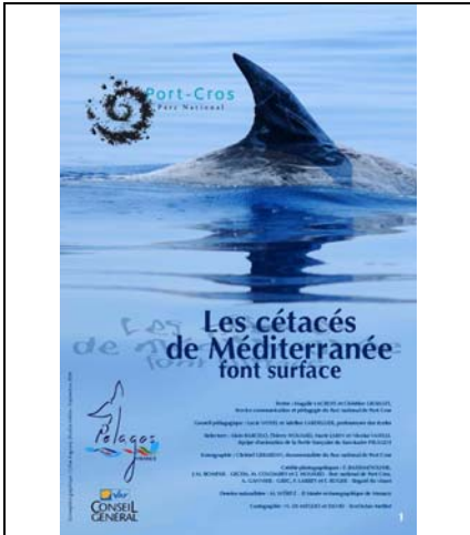
Les cétacés de Méditerranée font surface