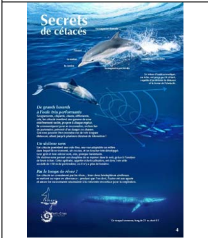
Secrets de cétacés