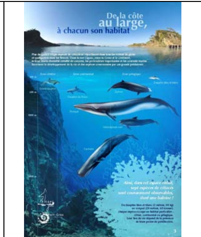
De la côte au large, à chacun son habitat